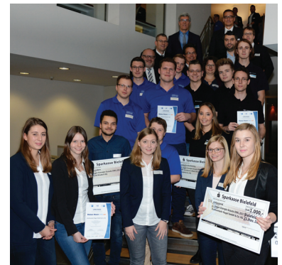
Die Siegerteams des Jahres 2017

Im Projekt „Energie-Scouts OWL“ machen sich Auszubildende in den Themenfeldern Energie- und Ressourceneffizienz fit. Als „Energie-Scouts“ decken sie Schwachstellen in ihrem Betrieb auf, entwickeln Lösungen und sammeln im Team wertvolle Projekterfahrungen. So leisten sie einen aktiven Beitrag zum Klimaschutz, sensibilisieren ihre Kolleginnen und Kollegen und sparen bares Geld. In den bisherigen vier Runden haben die Auszubildendenteams Einsparpotenziale von über 1.000.000 Euro aufgezeigt und zum großen Teil schon umgesetzt. Ihr Engagement rechnet sich also!