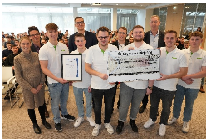
Das Siegerteam des Jahres 2025 kommt von Wago.