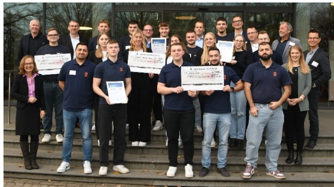
Bei der Preisverleihung 2024: Die Siegerteams mit der Jury